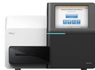
卓上次世代シーケンサー